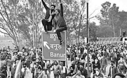
సంయుక్త కిసాన్ మోర్చా సభ్యులతో కలిసి