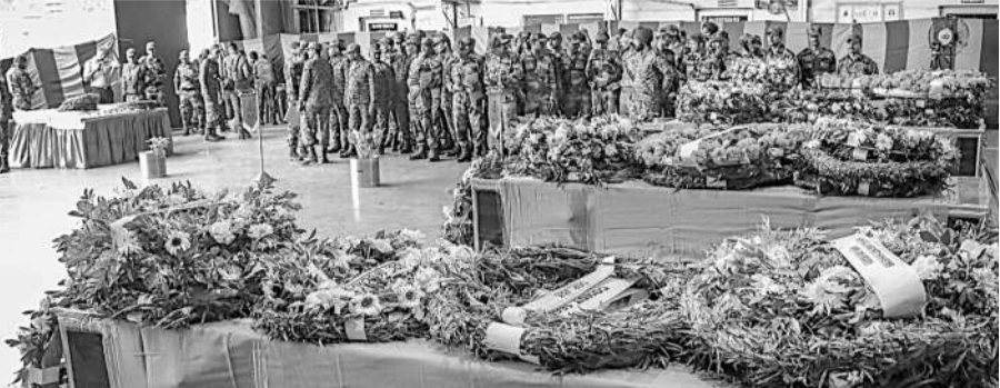
జమ్మూ కశ్మీర్ లోని దోడ జిల్లాలో మంగళవారం జరిగిన ఎన్ కౌంటర్ అమరులైన జవాన్ల భౌతిక కాయాలకు సవాళులు అర్పిస్తున్న సైనిక సోదరులు

దోడ జిల్లాలో ఉగ్రవాదులతో కాల్పుల పోరు • ఉగ్ర అమాకీకై అదనపు బలగాలు మోహరింపు